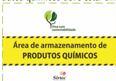
Identificação padrão da área

A área de armazenamento de produtos químicos deve estar sinalizada e identificada.