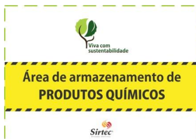
Identificação padrão da área

A área de armazenamento de produtos químicos deve estar sinalizada e identificada.